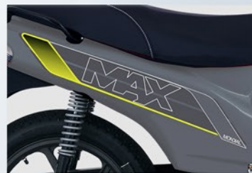
Nuevo diseño de gráficas y colores.