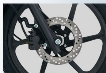
Freno delantero de disco.