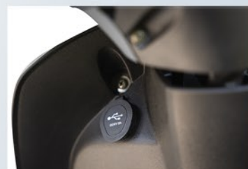
Puerto USB A-C.