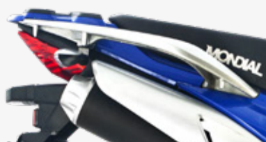
PORTA EQUIPAJE TRASERO EN ALUMINIO